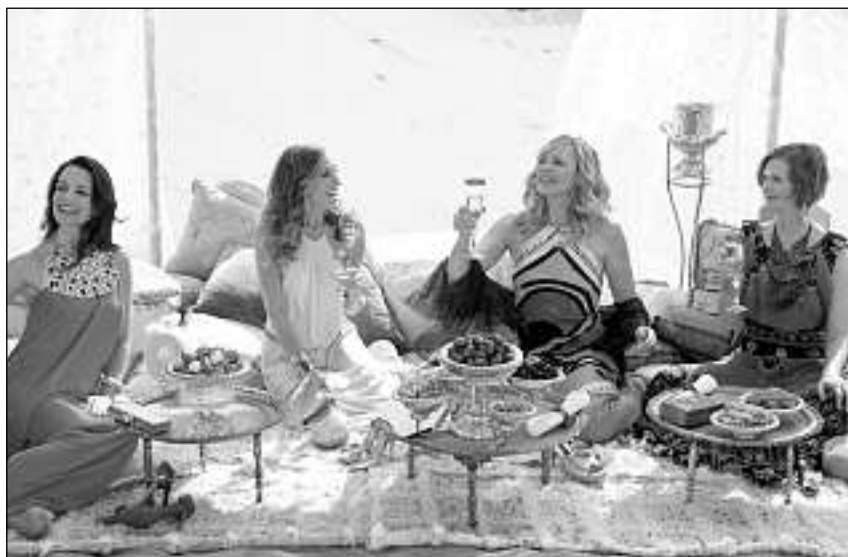
Sco tier Jasmin ed Aladin – mo cun cocktails.

Miranda Hobbes è zinica e gnanca zitg romantica. Ella sa concentrescha sin sia carriera, ma tuttina ha ella trasora insatge cun il barkeeper Steve. Cura ch'ella vegn en speranza smirveglia ella sezza il pli fitg, ch'ella sa decida per l'uffant e suenter in lung vi e nà era per Steve.