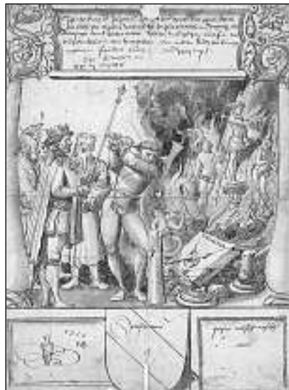
Niklaus Manuel Deutsch «Il retg Josias lascha destruir ils idols pajauns», 1527.

Cun tge motivs er'ins cunter ils maletgs en baselgias? La veneraziun dals maletgs, l'idolatria, eran per l'umanist Erasmus «narradads pietusas» ch'el ha descrit en sia ovra «Lob der Torheit». Personas