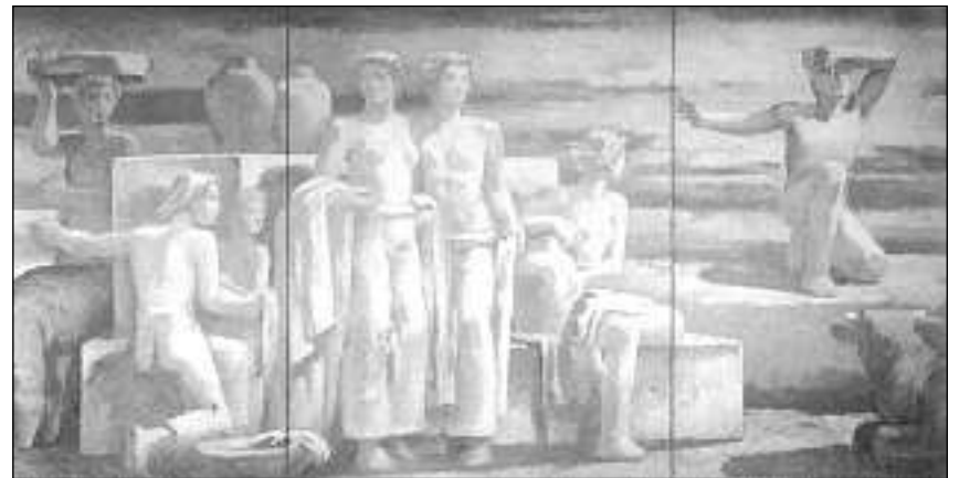
Karl Walser «Pievel da pasturs II», 1939.

L'Emprima guerra mundiala ha tutgà l'entira pictura en Svizra. Lioms multifars, che avevan pussibilità fors per l'emprima giada in barat cultural activ, èn vegnids tagliads. Ma era già avant l'Emprima guerra mundiala devi tendenzas d'opposiziun cunter l'avertura culturala. Quellas