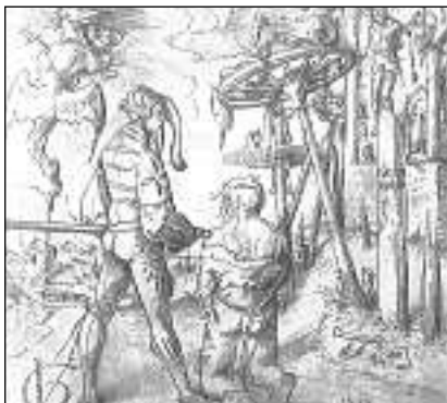
Urs Graf «Il lieu da la furtga», 1512.

En il 16avel tschientaner vegnivan dentant era creads dissegns che cuntengnan ina critica sociala. Ils maletgs che mussan visions sgarschavlas dal mund e motifs plain crudavladad, sco per exempel quels dal pictur Urs Graf, vegnivan malencletgs per in lung temp. Ussa realisesch'ins però che quests dissegns fan part d'in moviment per la pasch che ha cumenzà cun Erasmus e ch'è vegnì promovì dals refurmaturs: La guerra vegn condemnada radicalmain sco activitad absurda, betg giustificabla.