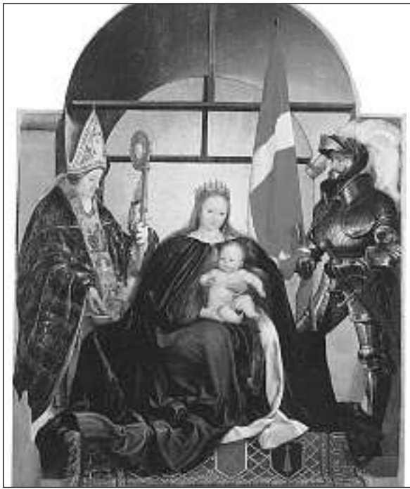
Das giadas Hans Holbein junior: La Nossadonna da Solothurn (1522) e la fatschada dal «Haus zum Tanz» a Basilea (1520-1522).

Cuntrari a Holbein junior che conuscheva era l'art talian, en ses contemporans restads orientads vers il nord ed il nordost, quai cun ina excepziun: Il pictur bernais Niklaus Manuel ha stgaffi in'unica ovra italianisanta per l'altar grond da la baselgia da Berna che mussa il siemi dal papa Innocens III. Cumpareglià cun lur contemporans avevan Hol-