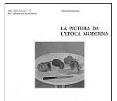
Cuverta da l'ovra «La pictura da l'epoca moderna».

En la pictura dal 20avel tschientaner pon ins constatar in interessant cuntrast: D'ina vart stattan la basa raziunala da l'art, la perscrutaziun da las proceduras e dals elements, sco era la scola. Da tschella vart stat la personalisaziun e l'isolaziun radicala da la lavur artistica, accumpagnada da la mistificaziun da l'artist e dals products artistics. Emprovas da surmontar quest cuntrast èn restadas senza grond success; la reclusiun en il 20avel tschientaner survegn ina dimensiun che tanscha sur la situaziun individuala d'in pajais e sur las constellaziuns politicas ora. Questa dimensiun pli vasta è visibla en ils maletgs dad Alberto Giacometti: l'artist ha bain modellà sper personas serradas en er da quellas prontas per partir, ma el ha mallegià mo praschuniers – praschuniers dal giatter da lingias en il spazi e da la surfatscha da la taila.