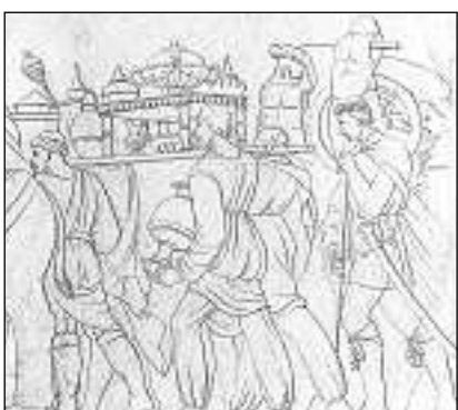
Andrea Mantegna (sura) e Hans Holbein junior (sut): «Triumf da Cesar».