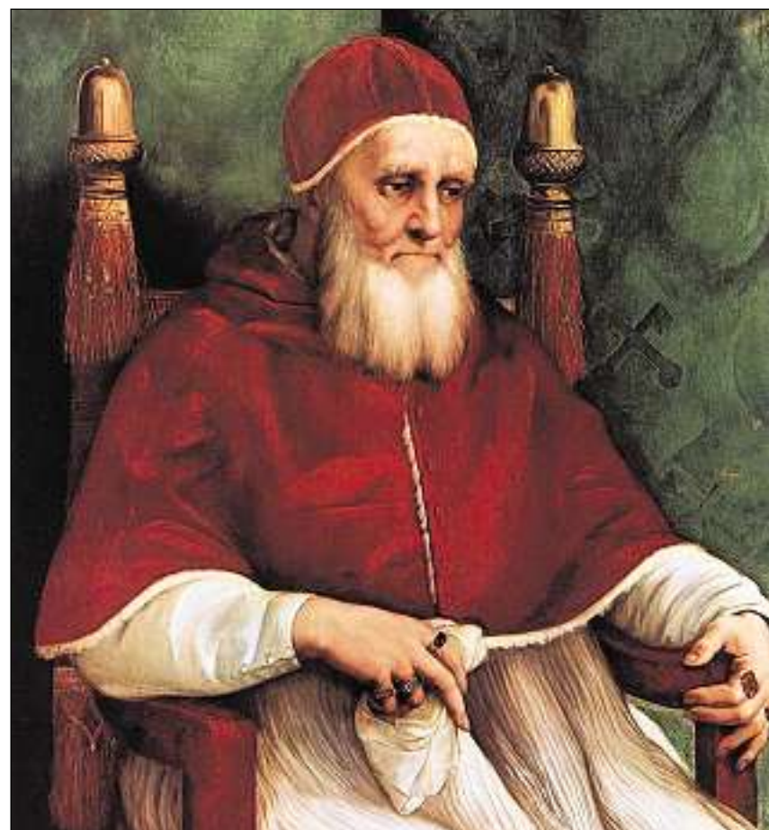
Papa Julius II, il fundatur da la guardia svizra l'onn 1506.