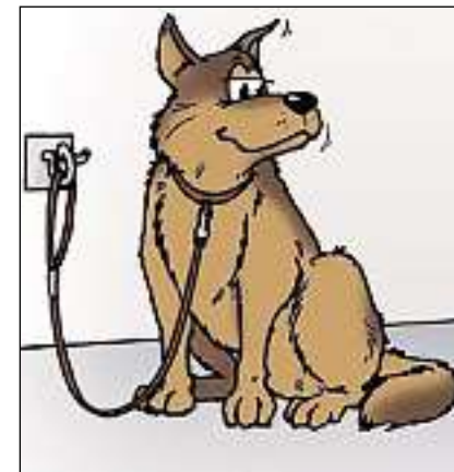
In chaun nunenconuscent na duain ins betg stritgar.

– Cur ch'in chaun curra vers l'uffant, duai quel sa fermar e star airi a furma da por culla bratscha lung il corp.