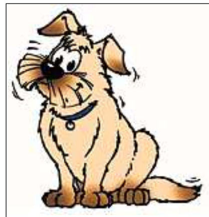
Era Grufi po sgrignir, sch'el na vegn betg tractà correctamain.

Uffants vesan il chaun uschè sco che lur