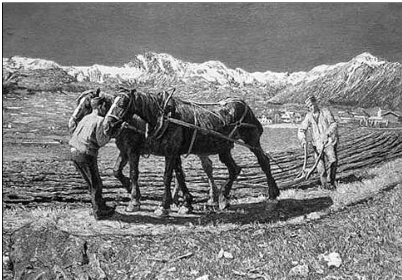
L'ovra famosa «l'arar» ha gi in success enorm a Paris e Londra.

Il 1894 sa chasan ils Segantinis a Malögia. En quest lieu da spartida e da traversada tranter la Bregaglia da temprina e la planira auta engiadinaisa inspirada dal nord s'offreschan a Segantini d'ina vart scenaris da la natira autalpina e da l'autra vart contacts cun glied da l'entir mund, la quala sa raduna là al zenit dal svilup turistic da l'Engiadina. La famiglia aveva uss in tagnairchasa burgais. Ella era ritga, il bab enconuscent e tgemblà cun distincziuns e diploms. La produczion artistica da Segantini era pitschna, ord vista da la tecnica da malegiar però da perfecziun maximala. Sias ovras avevan ina forza espressiva da nivel litterar e filosofic. Las ovras principalas tardivas gievan directamain ad ina clientella internaziunala. Segantini aveva ina correspundenza extendida. Sias ideas artisticas ha el exprimì en texts publitgads pli tard. El possedeava ina gronda biblioteca, s'infurmava regularmain davart las activitads