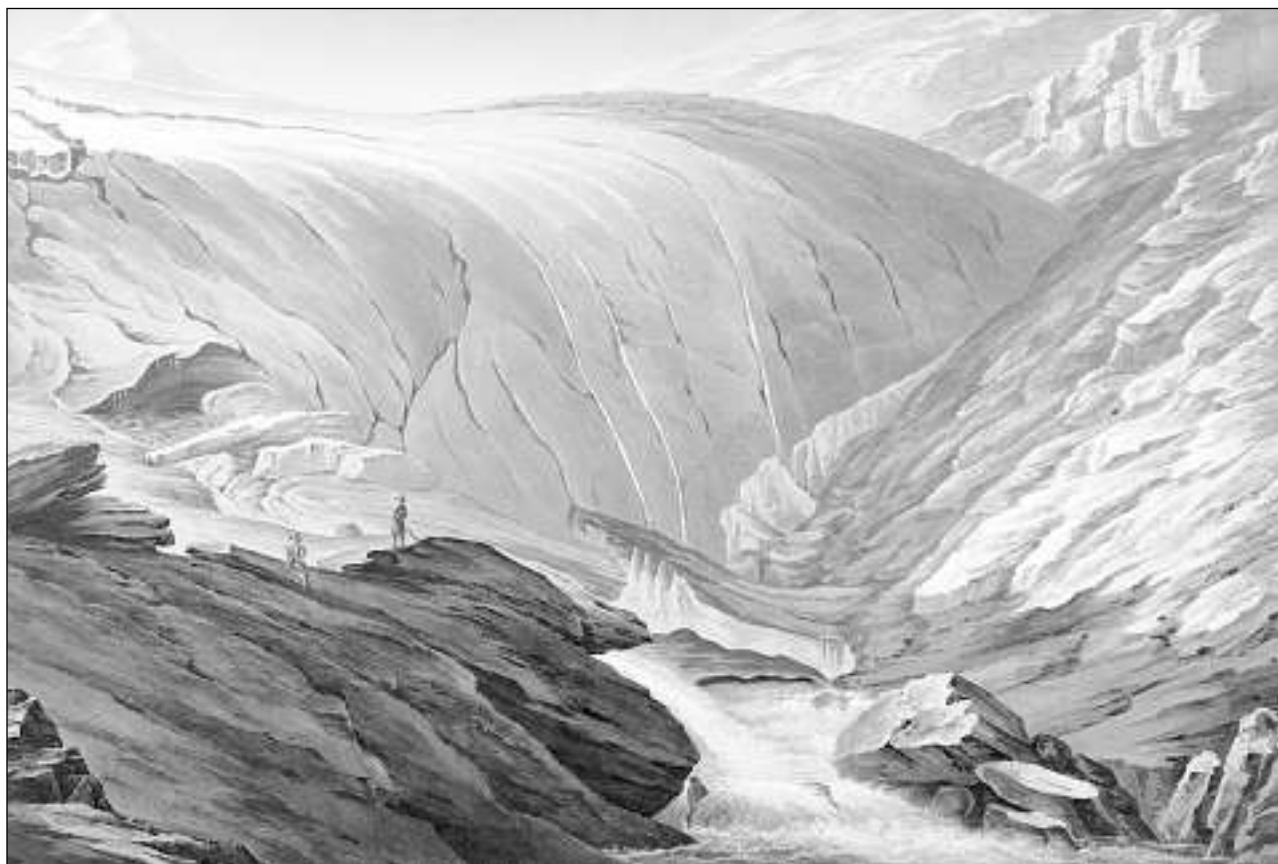
La tgina dal Rain Posterior cun il Piz Valragn che Placi a Spescha ha ascendi il 1789 sco emprim uman – da lez temp ina gronda ristga.

va da perder la colliaziun. Perquai ha il pader ingenius recognoscà ina «via laterala» sur il Lucmagn u la Greina (oz protegida a moda severa) ed ha surmuntà ses anteriurs dubis. Cuntinuaziun suonda