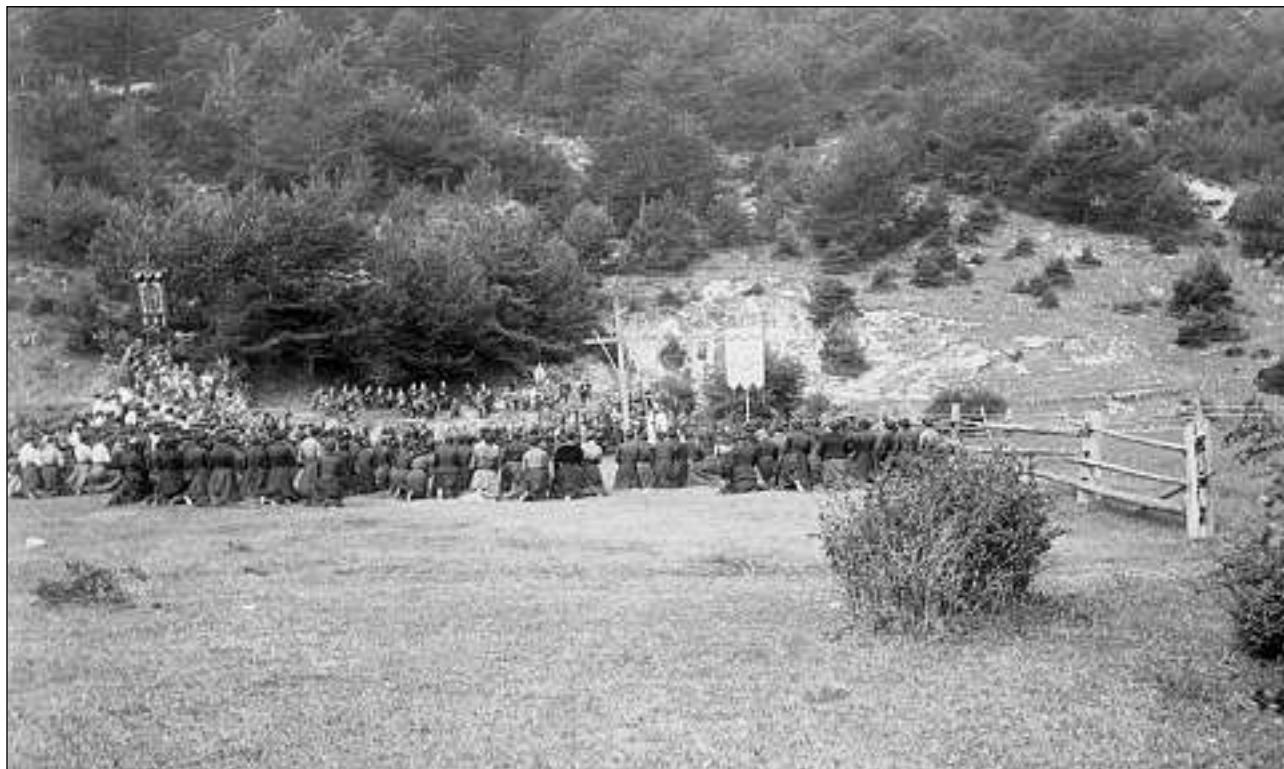
Processiun da funs a la Cresta da Morts, 1910.