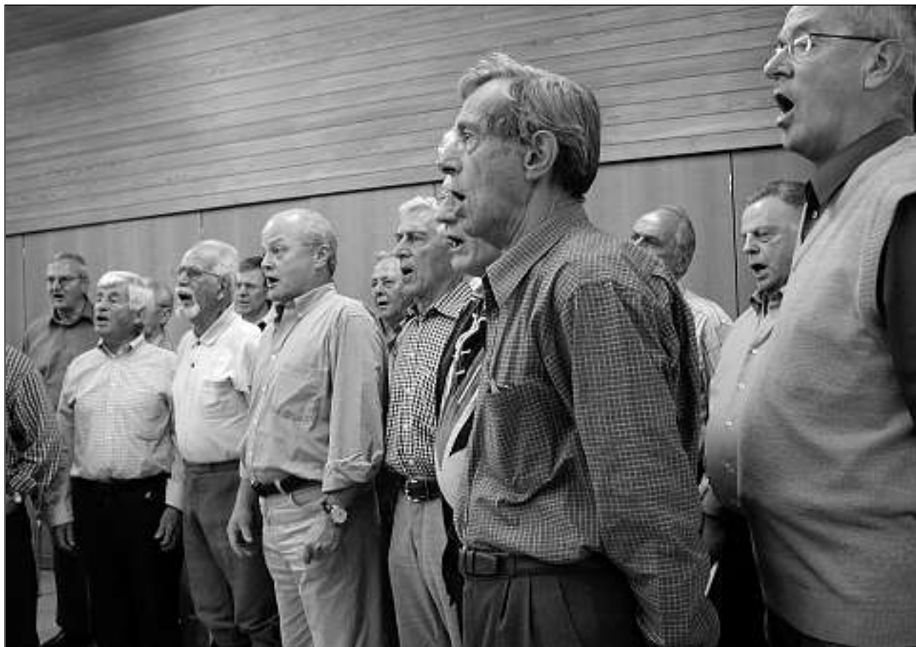
Ils 26 chantadurs derivan cunzunt da la Surselva, Sutselva e dal Surmir. La fracziun ladina duvrass rinforzament.

Il chor cumenza il mardi saira a las 19.30 cun l'exerchezis. Suentar in'ura da chant intensiv vegn mintgamai fatg ina pitschna pausa e baterlà in'urella. Lura