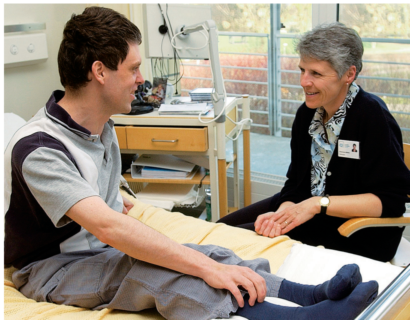
Prender peda: contacts regulars, era cun ils pazients, creeschon fidanza.

Accompagnar entaifer ed ordaifer la clinica speziala ils umans paraplegics e lur confamigliars sin lur via difficila, signifi-