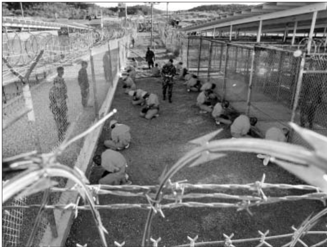
La direzia dal contract social pon ins betg sutvalitar: il mintgadi a Guantanamo.