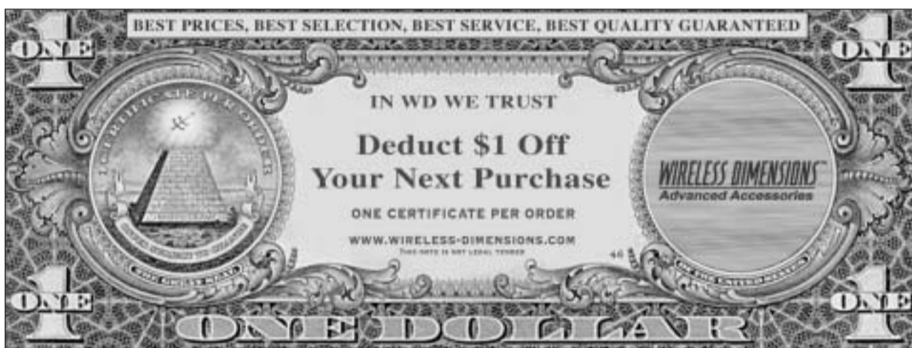
Globalisaziun madem sco americanisaziun?

Ma sch'ins guarda exactamain, ves'ingia a la surfatscha grondas differenzas en il svilup da la globalisaziun. E sch'ins va pli a fund, chatt'ins ragischs che cumprovan a moda zunt interessanta, quant ferm che sa differenzieschan anc oz continents uschè vischins sco l'America e l'Europa.