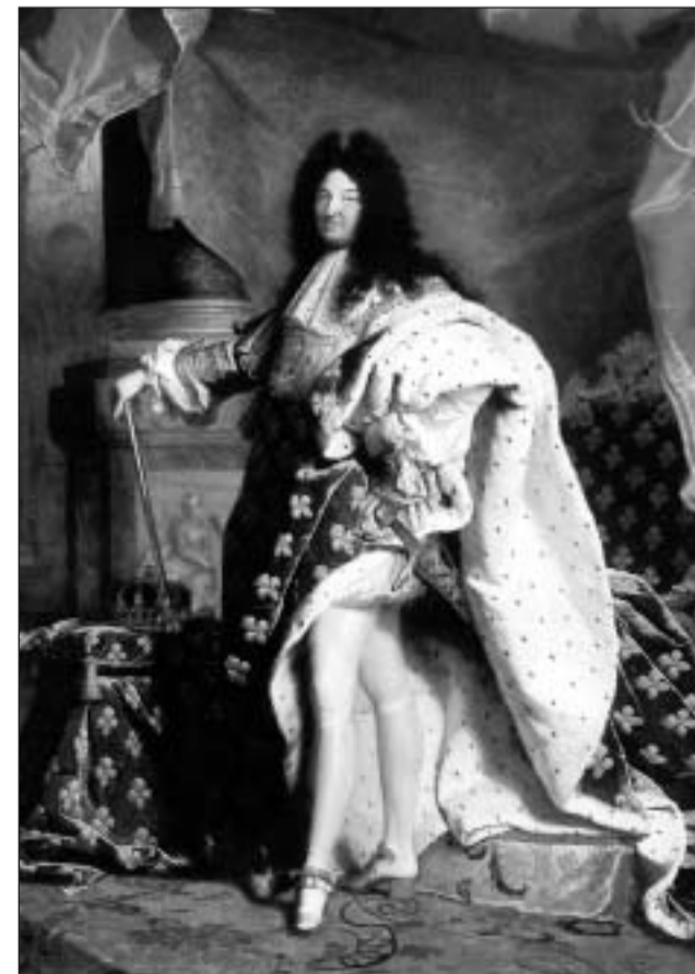
Louis XIV, autocrat, monarc per grazia da Dieu, è ozendi inimaginabel.