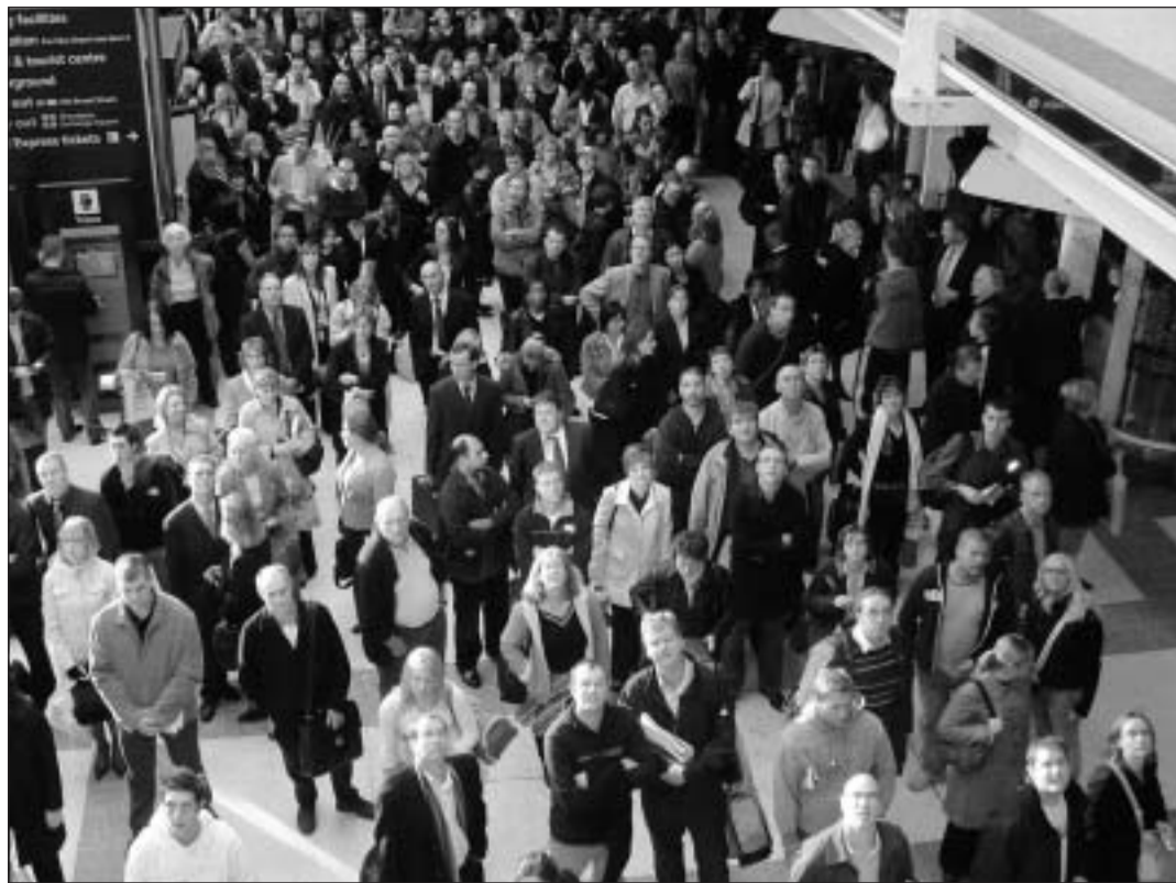
Il singul anonim en la massa sco nov regent.