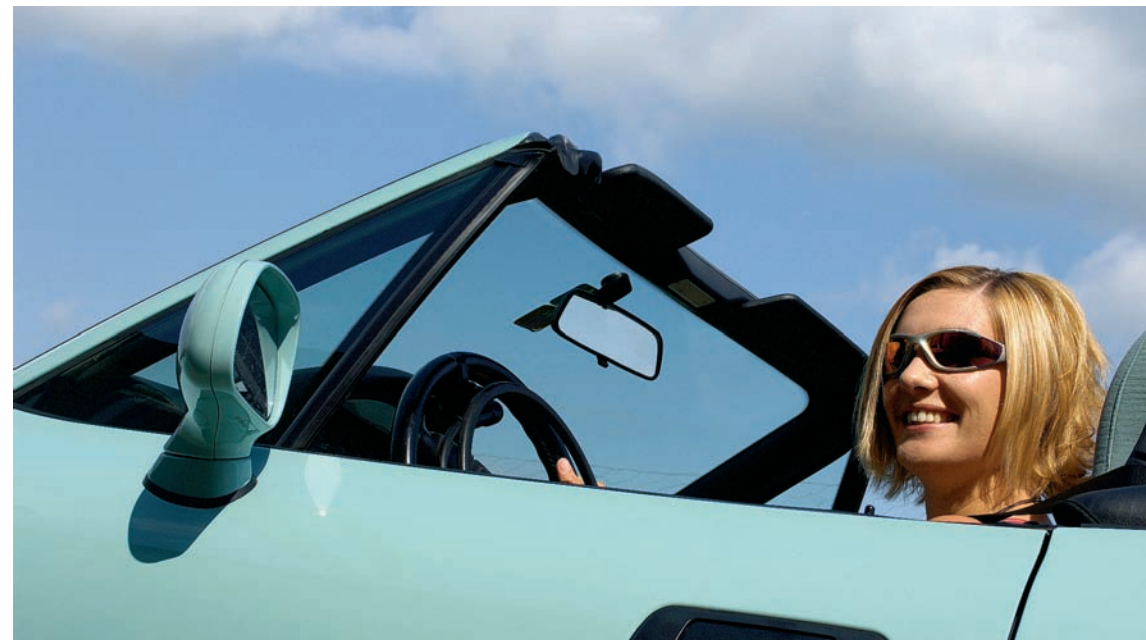
Libertad: «Charrar senza tetg per il mund enturn è in bellezza sentiment.»