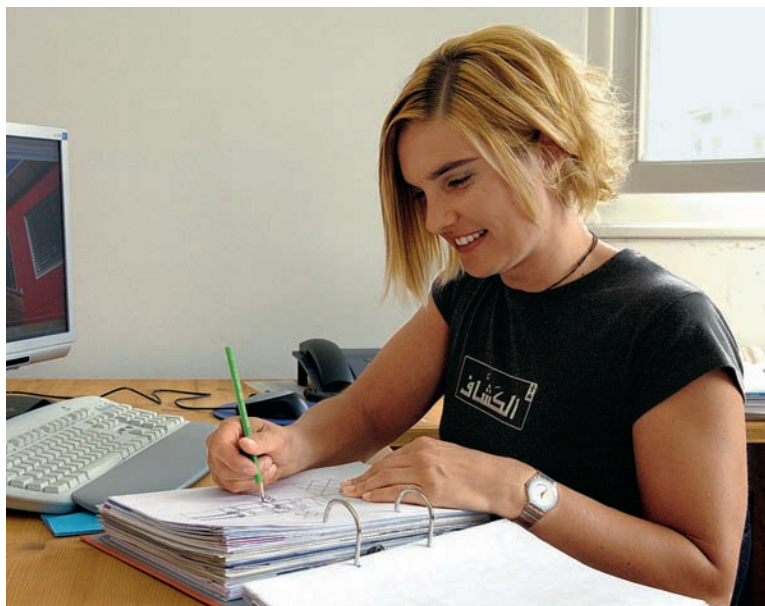
Finamira professionala: la giuvna architecta fa ina scolaziun supplementara sco biologa da construcziun.