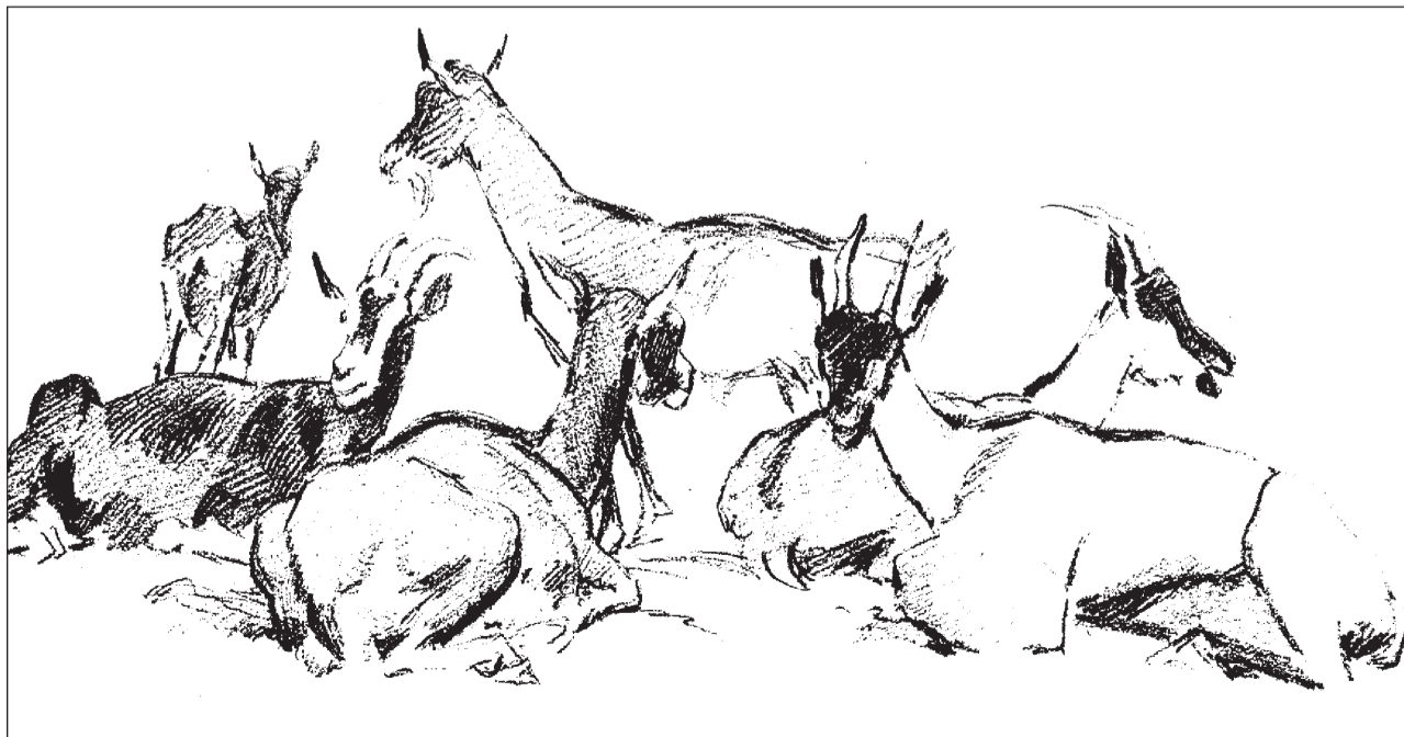
«Sis chauras» (1854, rispli sin pupi). Dessegns eran per Koller be in med per cuntanscher la finimira: «Malegiar è l'incumbensa dal pictur, na il skizzar.»

Picturs che lavuravan en differents pajais, sco Koller u Segantini, han plinavant savens transportà tratgs specifics da razzas d'animals da niz sur ils cunfins dal pajais, surtut cura che la pictura vegniva finida en l'atelier. Per Koller èsi cler ch'ina buna cumposiziun n'è betg cuntanschibla unicamain cun meds dal naturalissem. I dovrà il «mument suggestiv», la «copulaziun da la fantasia e dal spiert cun il pudair e savair». Perquai ston ins far atenziun cun interpretar las razzas d'animals da vegls maisters.