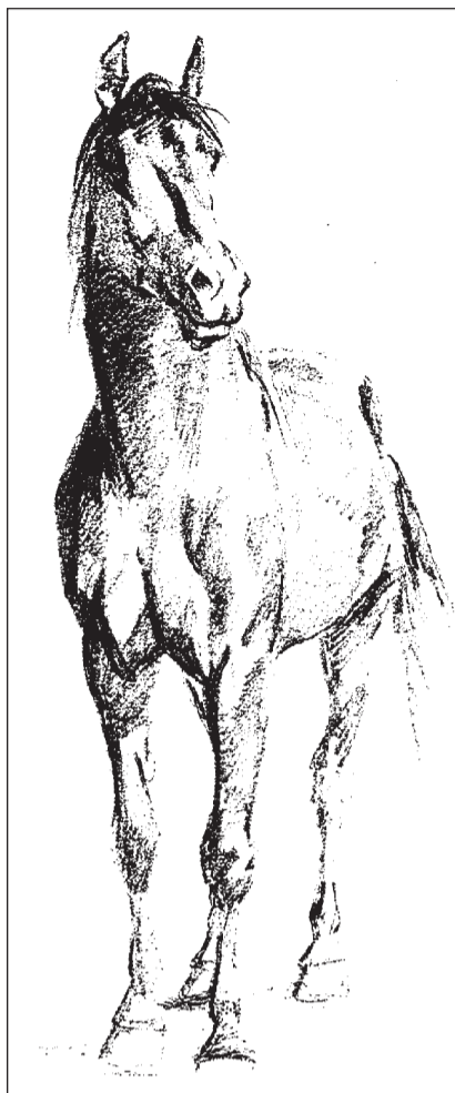
«Pulain davant en» (1850, rispli sin pupi) – ina da las bleras studias d'animals.