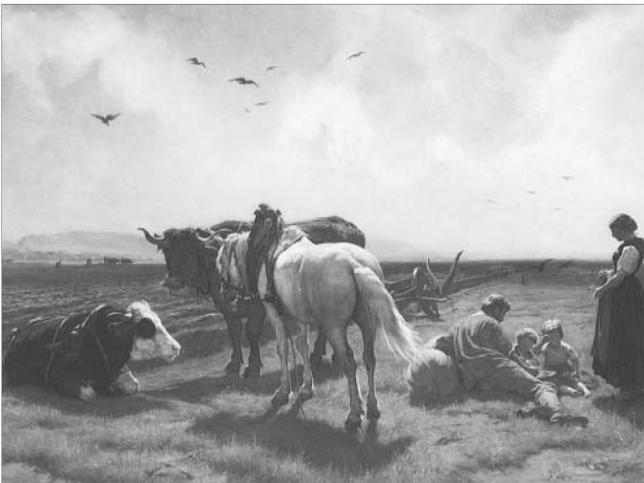
«Gentar en champagna» (1866, ieli sin taila da glin) – in dals paucs maletgs ch'el ha realisà a Roma, cun l'orizont tipic bass.