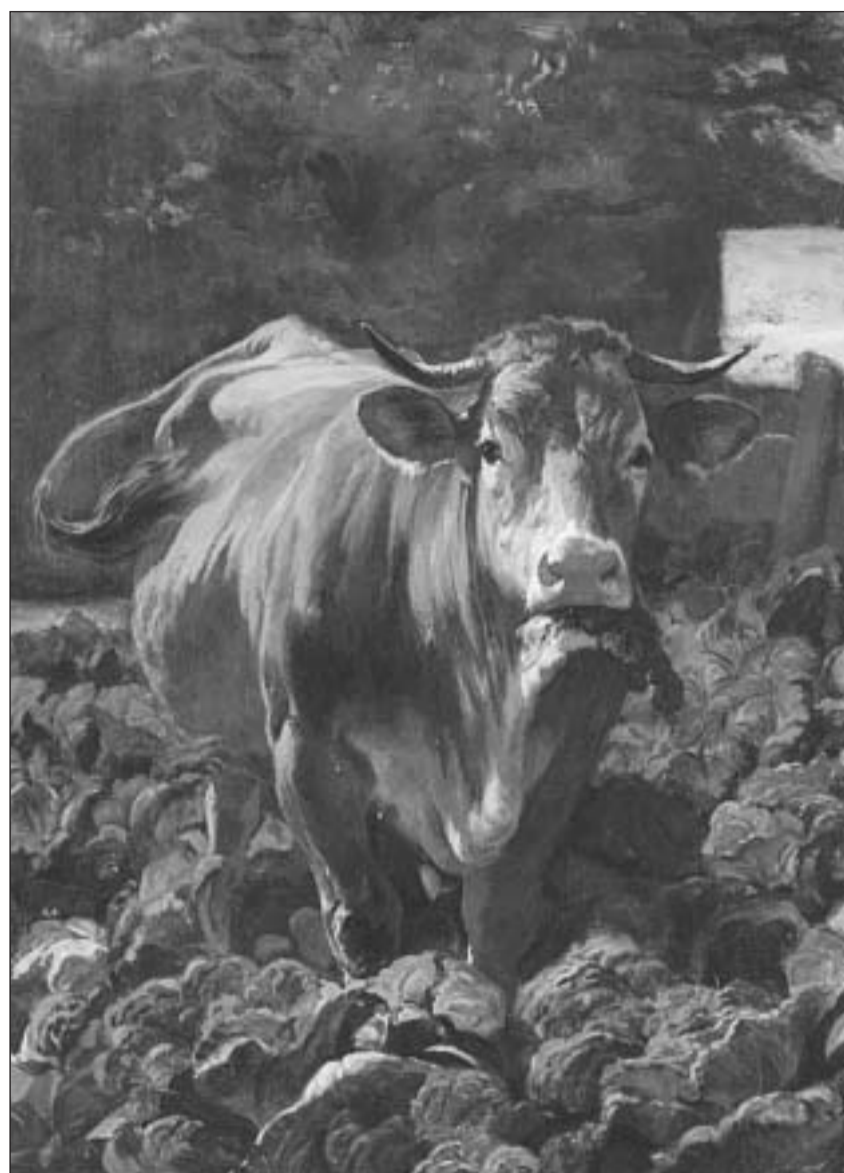
«Vatga en curtin d'ervas», (1857/58, ieli sin taila da glin) – la vatga la pli enconuscenta da Koller.