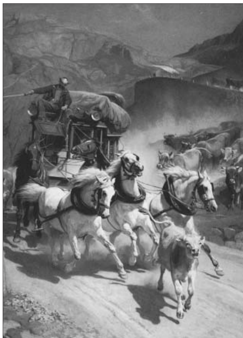
«Posta dal Gottard», (1873, ieli sin talia da glin) – il pli enconuschent maletg da Koller.