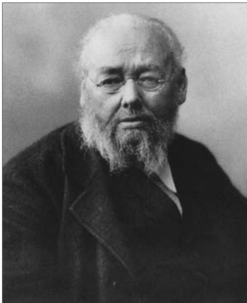
Purtret dal «pictur» Rudolf Koller, 1888 fotografà da Rudolf Ganz. FOTOS CHASA D'ART TURITG