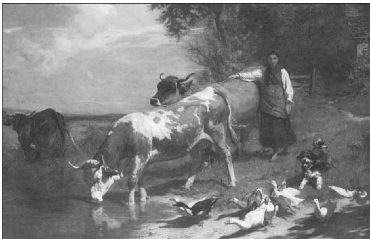
«Al bravadir» (1865, ieli sin taila da glin) – in dals paucs maletgs che Koller ha resguardà era ils animals pitschens.

Era questa pictura renumada sa sviluppa, sco bieras autras, sur differents stgalims, pliras skizzas ed in sboz d'ina charrotscha a dus chavals, enfin a la cumposiziun definitiva da la charrotscha a tschintg chavals – ina da las ovras las pli popularas da l'art svizzer. Per l'admiratur silenzius dad oz èsi grev da chapir pertge che Koller, fitg critic cun sasez, n'aveva betg gronda simpatia per quest maletg: «El na posseda betg blier d'ina pictura. Il meglier è atgnamain il titel.»