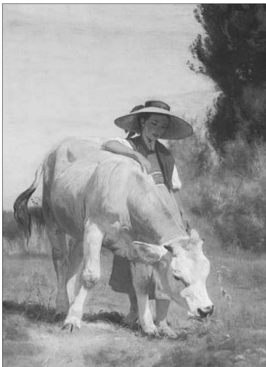
«Mattatscha cun vadè» (1866, ieli sin taila da glin) – in maletg dal temp da las colurs clerass.