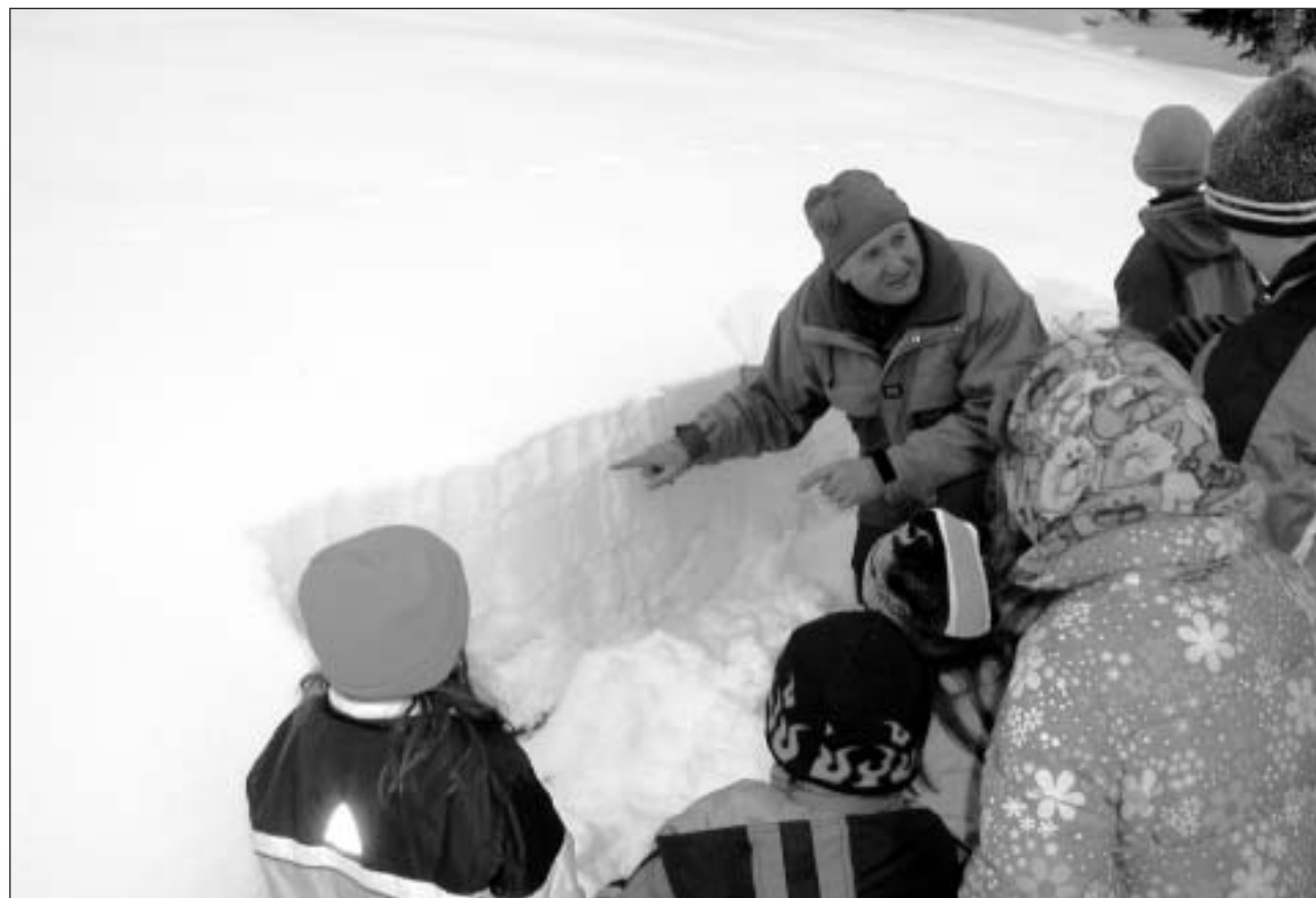
Reconstruir «l'istorgia da la naiv» da quest inviern cun examinar ils cuflads.