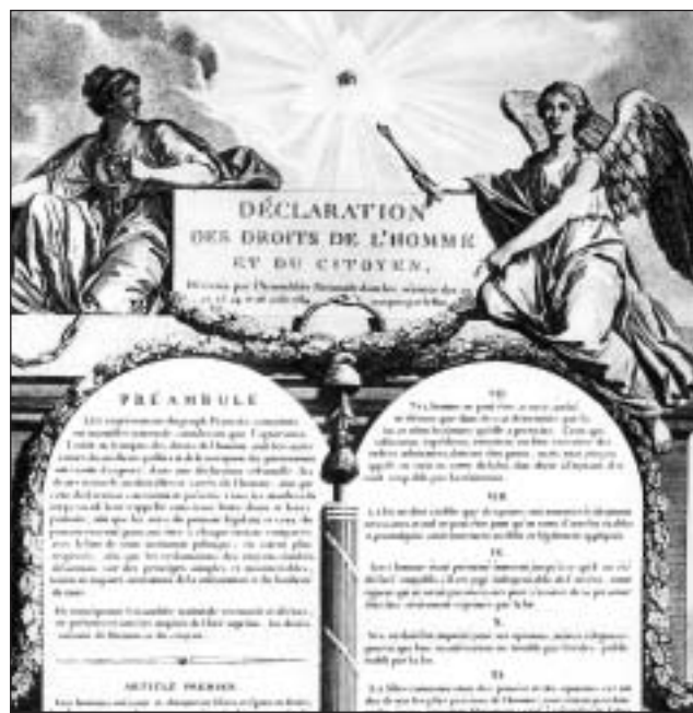
1945 han ins finalmain pudì fixar la noziun da dretgs umans, cun vigur globala, en la charta da las Nazions unidas.