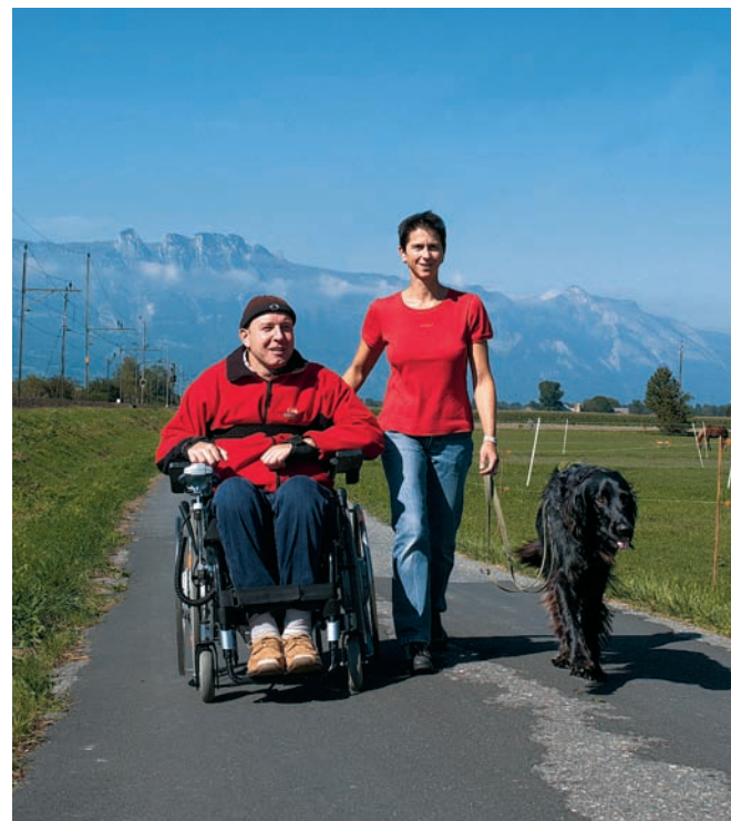
Ushè savens sco pussaivel van ils Kellers a spass en la bellezza cuntrada da Sevelen.