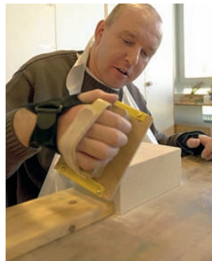
L'ergoterapia gida a dumagnar il mintgadi.