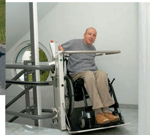
Grazia als 150 000 francs da la Fundaziun svizra per paraplegichers han ins pudì finanziar – tranter auter – er il muntastgalas.