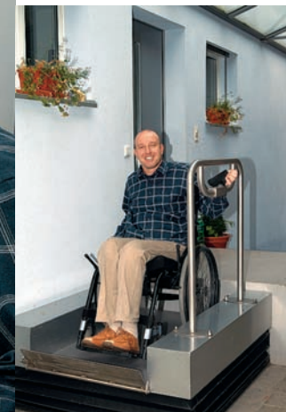
Ina punt idraulica speziala sper l'entrada è indispensabla per l'um en la sutga cun rodas.

«Il Center svizzer dals paraplegichers a Nottwil enconuschev'jau mo tras mia dunna. Ella era quella che pajava las contribuziuns per l'entira famiglia.»