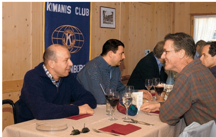
Divertiment e variaziun: mintga segund venderdi gentar cun ils collegas dals Kiwanis.