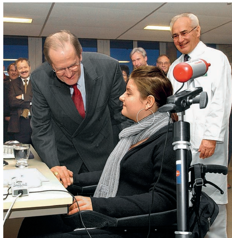
Auta visita: Il president da la confederaziun Joseph Deiss è impressiunà da quai che la giuvna Turitgaisa demonstrascha al computer.