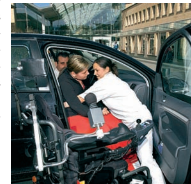
Ir a chasa per l'emprima gia: Per il transfer da la sutga cun rodas en l'auto ston duas persunas gidar.

adossar als geniturs. La Fundaziun svizra per paraplegichers surpiglia la finanziaziun, sperond ch'il resultat da las contractivas cun la SWICA na saja anc definitiv. L'ospitalisaziun a Nottwil è stada necessaria pervi da la paralisa supplementara da la respiraziun e la situaziun critica durant la fasa acuta, medemmain na pudev'ins pretender che la pazienta vegnia transferida durant la rehabilitaziun primara en ses chantun da domicil. Il fatg che talas diffe-