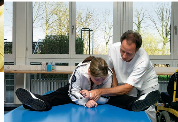
Chattar l'equiliber: La paralisa cumpletta da la bratscha, da las chommas e dal bist pretenda da l'anteriura giugadra da ballape blera pazienza e perseveranza en la fisioterapia.

sulegl sco duas stailinas da speranza. Consternà prenda el ils ureglins si da plaun ed als metta en il satg da las chautschas. – En l'Ospedale Civico a Lugano vegnan immediat stabilisadas l'aspiraziun e la circulaziun da la grev blessada. La radiografia d'urgenza mussa in maletg desastrus: il terz spinal dal culiez è rut – fractura da la tatona cun paralisa da la respiraziun – plinavant fracturas vi da tshintg spinals dal pèz. La contusiun massiva dal lom chaschuna ina restricziun fitg privlusa dal volumen da respiraziun che sto vegnir egualisada en-