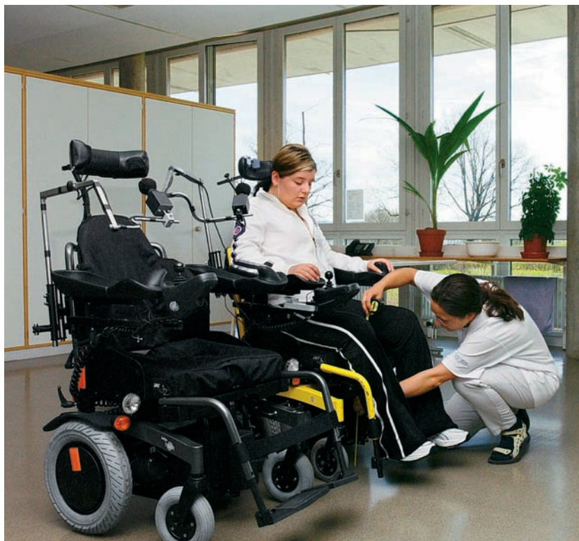
Grev mument: Mo en la sutga cun rodas electronica dirigibla cun il mintun po Fabrizia sa mover independentamain.