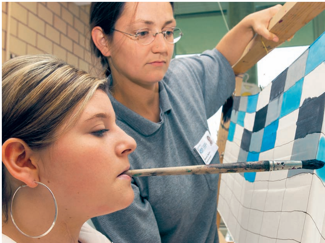
Scuvrir novs talents: Abilitads fin ussa nunconuschantas vegnan promovidas ed avran novas vias.

«Mes pli grond giavisch? – Che la paralisa da la beglia e da la scufla sa regenereschia, pertge che quella ma fa dapli pensiers che las chommas e la bratscha paralisadas. Vi da la sutga cun rodas ma sun jau endisada pli u main.»