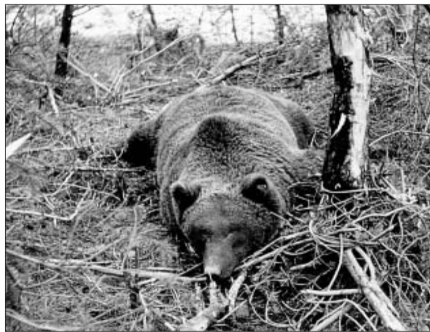
Sche l'urs vegn piglià per motivs da perscrutaziun en in latsch da pes elastic, sche sa dosta el zuar vehement, vegn dentant narcotisà immediat ord distanza.

La protecciun dals animals suletta na tanscha betg, sch'il spazi da viver vegn a medem temp destrui e parcellà adina dapli tras la civilisaziun da l'uman.