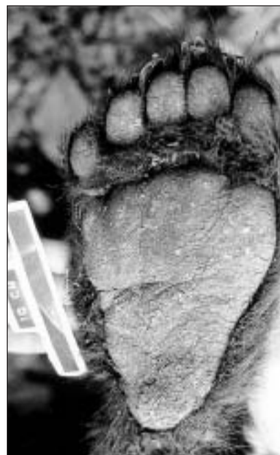
Toppa davos d'in urs brin, vesi da sutsi: Cumpar urs va sin la planta-pe, vul dir: el metta ses pe plat giun plaun.