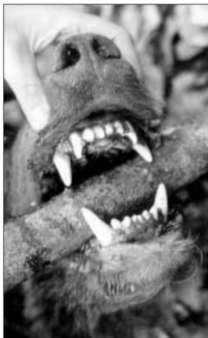
Malgrà sia dentadura da rapina è l'urs brin – cuntrari a luf e luf-tscherver – per 80 ubain anc dapli pertschient vegetari.

Oz, tschient onns pli tard, cumenz'ins en la protecciun da la natira a s'occupar danovamain da la dumonda d'in eventual return da l'urs. Èsi pussaivel che l'urs alpin, che viva oz anc en la regiun dal Trentino en l'Italia dal nord (cf. chascha), mo radund 40 kilometers davent dal cunfin svizzer (Puschlav), returna in di puspè en Svizra? La basa legala fiss dada: La spezia è protegida dapi il 1962.