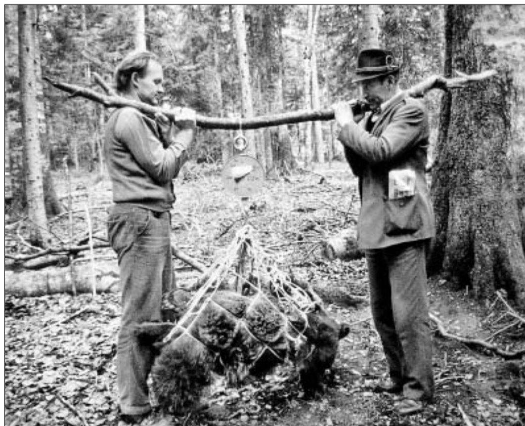
Mintga «urs da perscrutaziun» vegn sa chapescha era pesà, quai che sto succeder en ina cuntrada intransibla cun ils meds ils pli simpels.