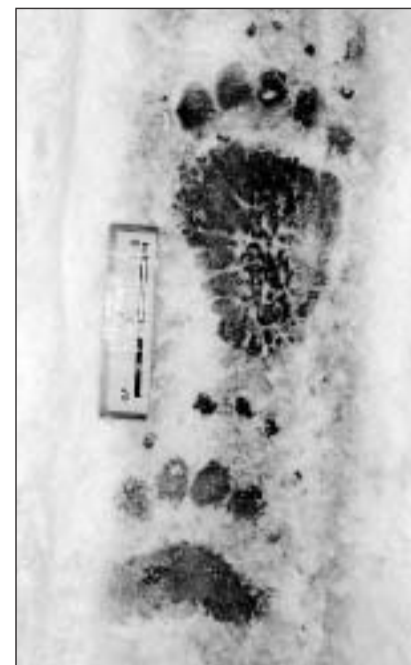
La perscrutaziun procura per infurmaziun indirecta sco fastiz, pelegna e sgriffels da raiver. Qua ina passida.