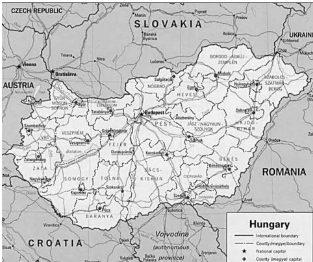
Dapi il 16avel tschientaner existivan contacts lucs tranter l'Ungharia e las Trais Lias (Grischun) D'emprims inscuters a l'università da Basilea, nua che students da tut l'Europa studegiavan, èn sa sviluppad pli tard d'ina vart numerus contacts a las academias teologicas da la Svizra e da l'Ungharia, da l'autra vart èn stads students e plevons ungarais pliras giadas en las Trais Lias.

Oz èn per gronda part crudadas en emblidanza las relaziuns istoricas tranter la Svizra resp. il Grischun ed il territori linguistic ungarais, da las qualas èn vegnidadas descrittadas qua in pèr paucas. Sch'ins discorra oz, 15 onns suenter la midada (1989), cun umans davart l'Ungharia e la Transilvania (Rumania), lura croda immediatmain la noziun Europa orientala. Dentant quest'Europa orientala na datti betg pli. Igl è da sperar che ultra da las relaziuns caritativas sa sviluppa era puspè ina nova colliaziun spiertala e teologica cun las cundiziuns politics midadas en Ungharia e Rumania e che l'affecziun istorica, surtut en la baselgia reformada, chattia uschia ina regardanza creativa ed ina cuntinuaziun degna.