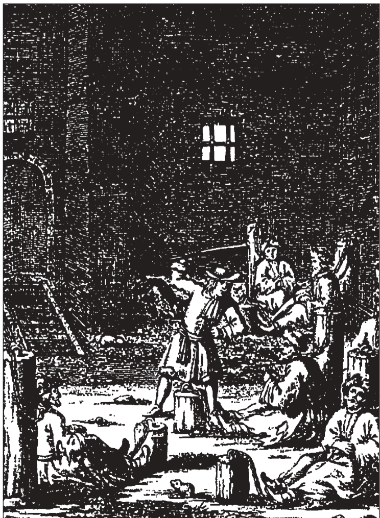
Plevons protestants da l'Ungaria en praschunia a Neapel.

Primarmain fa quai bain in pau smirvegliar, sch'il lectur dispot chatta a Neumarkt al Mieresch (Targu-Mures, RO) en la biblioteca da Teleki l'ovra renumada «Pallas Rhaetica» (Basilea 1617) da Fortunat Sprecher von Bernegg. Dentant sche nus suandain ils fastizs dal fundatur da la biblioteca da Teleki a Neumarkt, dal cont Samuel Teleki de