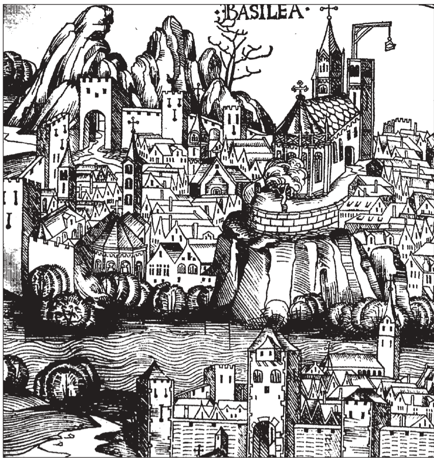
L'università da Basilea a l'entschatta da l'epoca moderna.

Facticamain è la baselgia reformada en Ungaria colliada dapi si'entschatta cun la reformaziun turitgaisa, spezialmain cun l'actività da Heinrich Bullinger (1504-1575), dal qual nus festivain quest onn il 500avel anniversari.