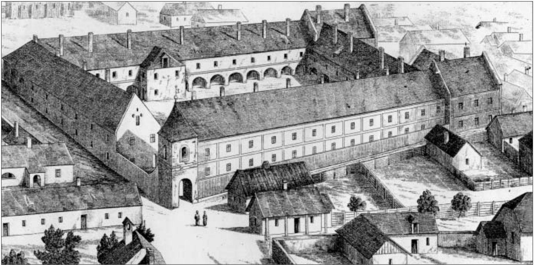
Il collegi reformà a Debrecen en il 18avel tschientaner.