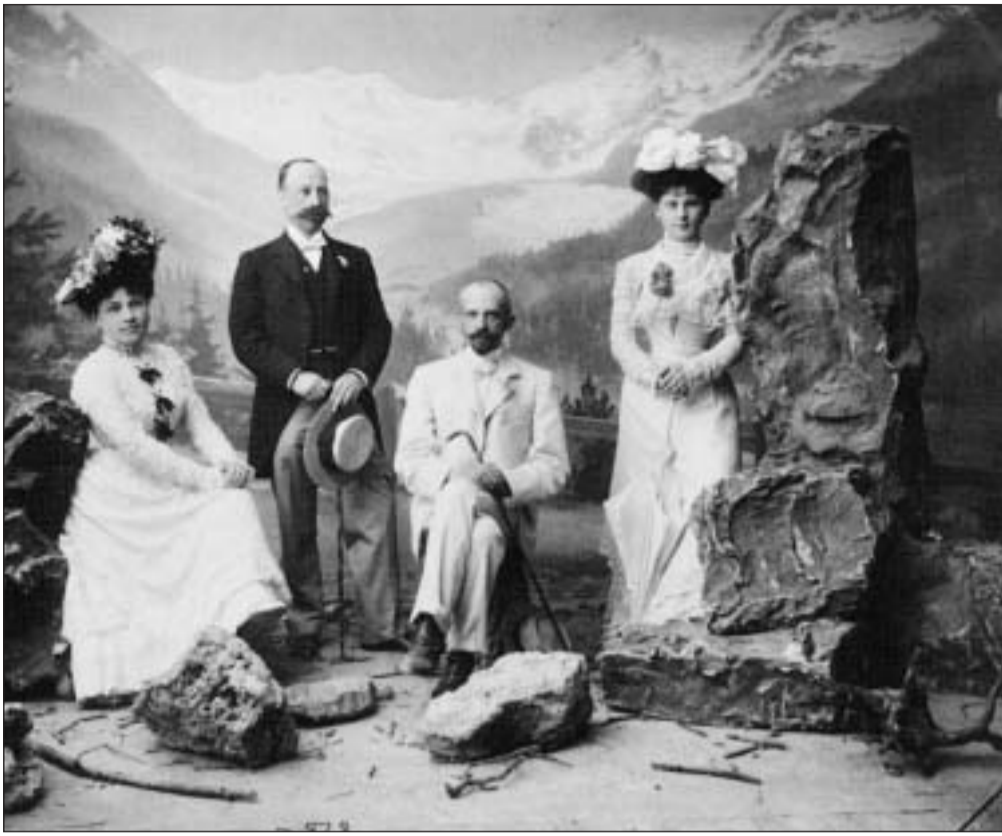
Citadins che fan cura a San Murezzan enturn 1900 en l'atelier dals fotografers Lienhard & Salzborn.