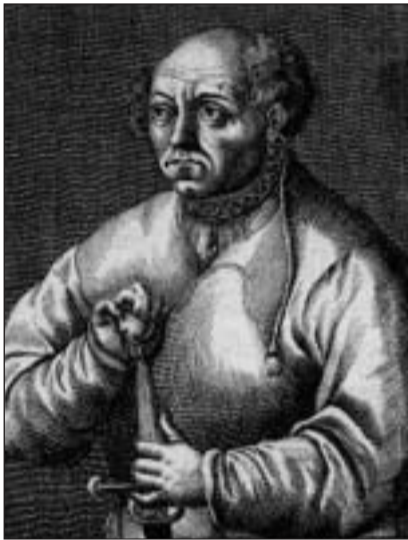
Paracelsus, il medi da cura a Pfäfers.

«Chrut u Uchrut», il cudeschet ch'il plevon Johann Künzle da Zezras ha publicità il 1911, è vegnì vendì dus mil-