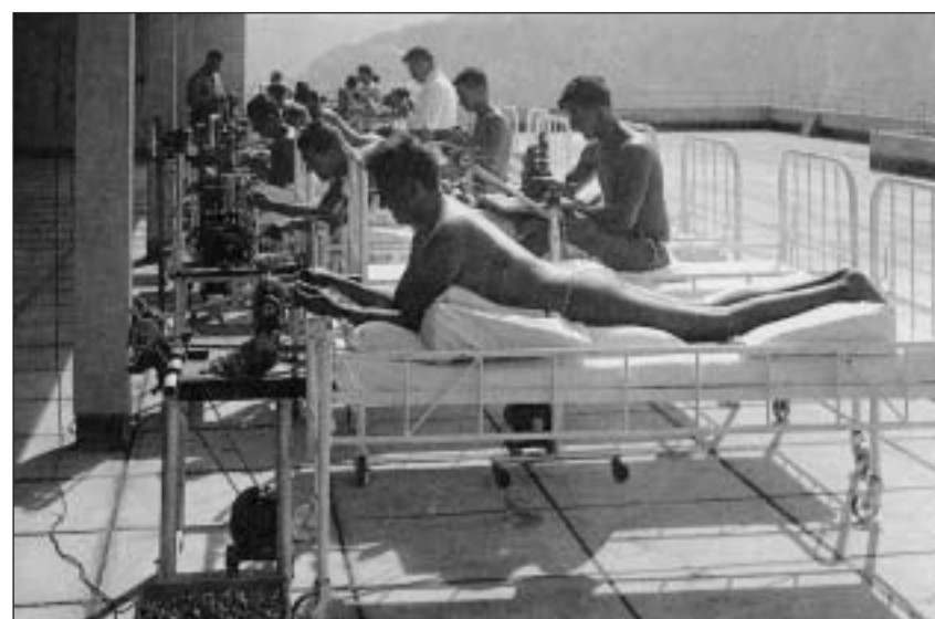
Helioterapia il 1930 a Leysin. Ils pazients lavuravan durant la terapia. Per uffants malsaus existivan scolas en il liber.

Pli baud cartivan ins ch'il tscharvè dal tschess barbet stgatschia il mal il chau.