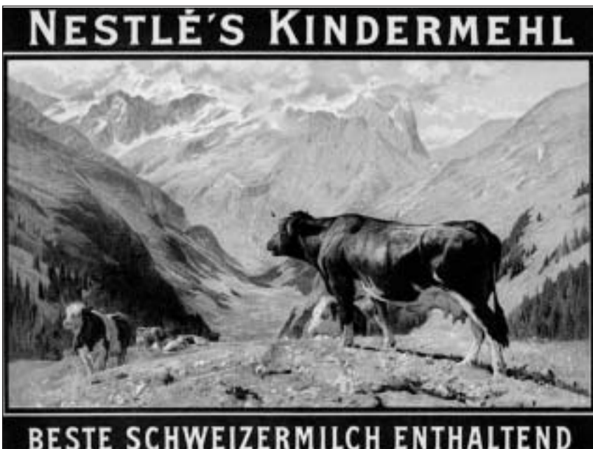
Reclama cun products da la muntogna.

Sch'ils pazients da tuberculosa prendivan tiers, muntava quai ch'els sajan sin buna via da vegnir sauns. Cun tant nutriment stueva quai bunamain funcziunar.