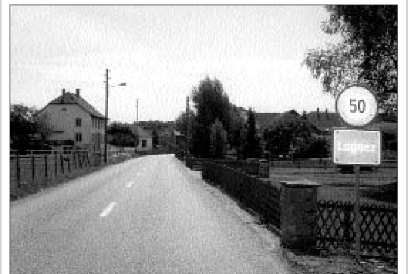
Entrada el vest dal vitg da Lugnez.