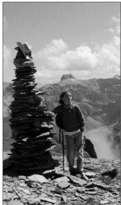
L'um crap dal Muttenwändli: En il lontan ves'ins il Muot da Rubi (Kistenstock), en la profunditad il Limmernsee.

Tessaglia. Las spundas da Glaruna n'enconuschan nagina remischun. Per fortuna n'avainsa nagin sturnizi, uschi pudessan nus gist sa manar e turnar