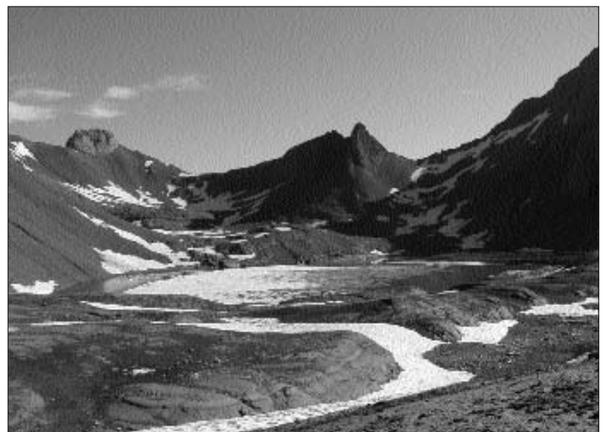
Anc il fanadur noda tocca da glatsch sin il Muttsee. E suten vivan peschs.