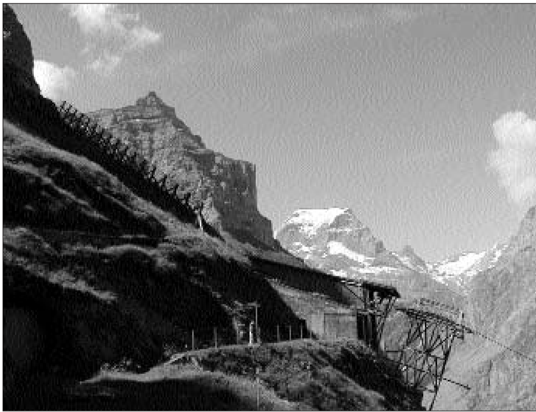
La staziun da la funiculara Kalktrittli: entamez il Tödi cun sia chapitscha da naiv, sanester il Selbsanft.