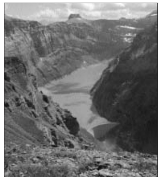
Il Limmernsee tschiffa aua d'in grond territori. Schizunt dal Klausen e dal pass da Pigniu vegn manà natiers aua.