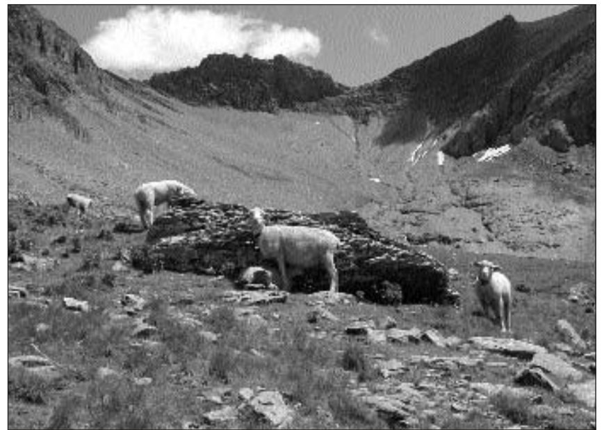
Nursas grischunas pasculeschan sin territori glarunais en l'Alp Nüschen.

Differentas variantas da questa tura èn descrittas en ils cudeschs «Wanderungen zu Bergseen in der Schweiz» dal WerdVerlag, u en «Glarner Überschreitungen» da la chasa editura Rotpunkt. La charta Tödi 1193 mussa l'entira ruta dal Tierfed fin l'Alp Quader.