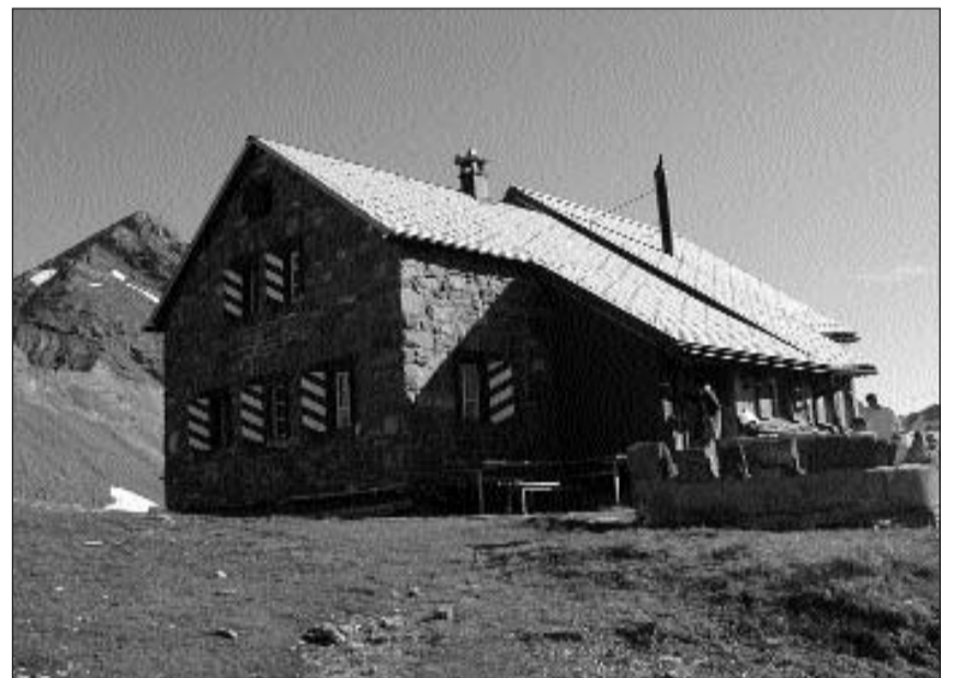
La chamona dal Muttsee ha plaz per settanta personas.