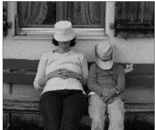
La redacziun sin viadi spetga il taxi en l'Alp Quadras.