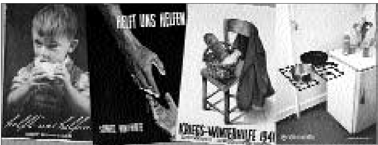
Art da placats cun l'ir dal temp: Ils placats dal succurs d'enviern dals onns 1938, 1939 e 1940 ed il placat actual, creà da Régis Golay, école cantonale d'art de Lausanne.

Conto da donaziuns dal Succurs svizzer d'enviern: Conto postal 80-8955-1