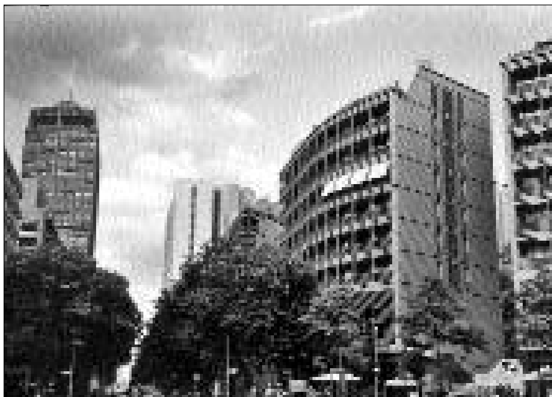
La nova fatscha da la veglia chapitala.