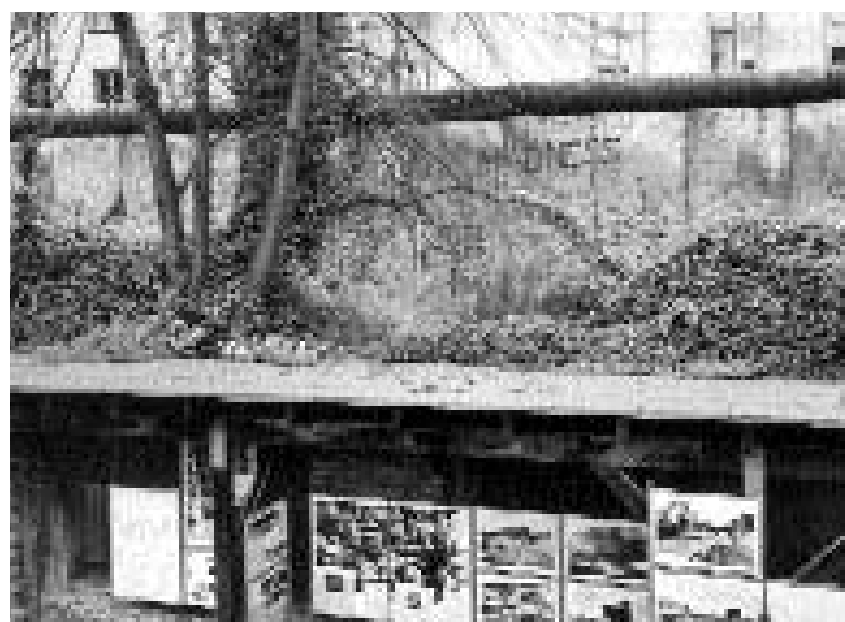
Rests da dus systems terroristics. Su: restanzas dal mir da Berlin, sut: exposiziun davart la terror dals nazis en rests dals tschalers.