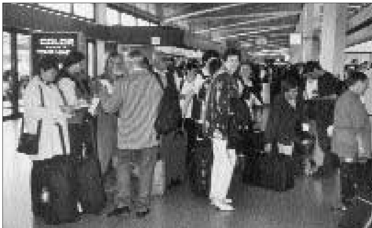
Adia Berlin – ed a revair!

Cura ch'ins va per ina curta dimora a Berlin – ina citad da radund 3,5 milliuns abitants e pir dapi 12 onns puspè reunida – ston ins metter ordavant prioritads. Senza in bus – a pè na pon ins betg cuntanscher blier – ed in bun guid local na fiss i gnanc pussaivel da guardar las pli impurtantas attraziuns