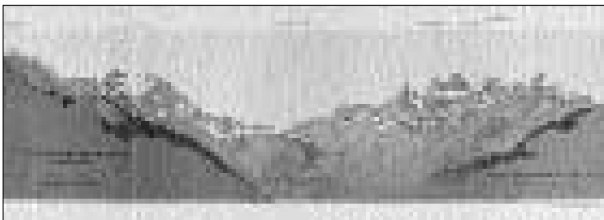
Sulzfluh e Drusenfluh (Rätikon). J. Müller-Wegmann.

ils panoramas era accents. Ed in piz allontanà, che svanescha sin ina fotografia, po en in dissegn vegnir accentuà.