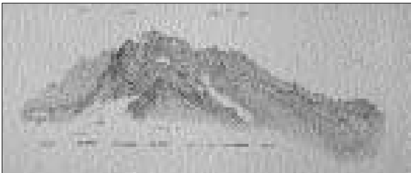
Albert Heim, il retg dals panoramas, ha dissegnà il Tödi dal Pass Sandalp anora. (publitgà en l'annala 1877 dal Club alpin svizzer)

Qua sa mussa era las qualitads dals panoramas. Entant che las fotografias reproduceschan be la vista, porschan