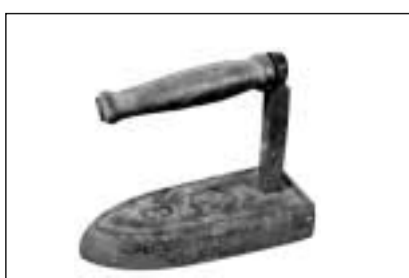
Fier cun si il reliev d'ina vopna cun la crusch svizra (Trun).