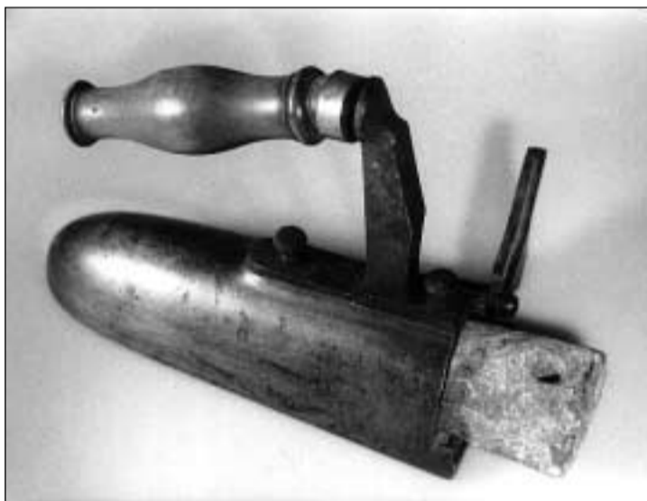
Fier da crap. Quest fier è vid endadens ed ha a l'interiur in crap u in toc fier che vegn tut or per vegnir stgaurà. Qua è il toc da mez in crap.

Or da la Surselva vegn la suandanta engiavinera, che sa basa sin in giu da plects: «Stauschas ti mei, sche fetsch' jeu star eri; leis ti star eri mei, sche brisch' jeu tgei che jeu poss tier (il fier da resti)».