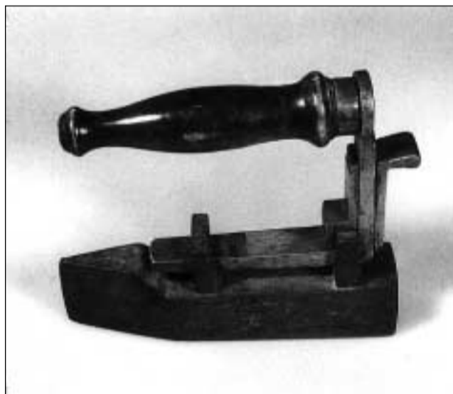
Fier da cusunzas u fier da cusadiras. Tar quest fier prend'ins davent il moni per stgaurar il pe ch'è da fier massiv.