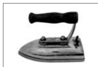
Fier electric da metal surcromà e cul moni da lain (Cuira, enturn il 1925).