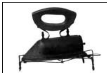
Fier da crap cun serrà il viertgel davosvart e cun in moni da lain (Tumegl).