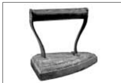
In'otra furma da fier (Cuira).