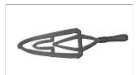
Pusafier ornamental (Stampa).