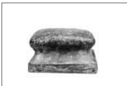
Simpel bloc da fier per stirar (regiun tranter Zuoz e Soglio).