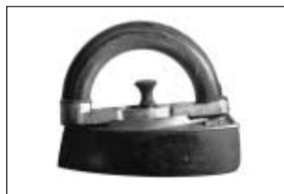
Fier massiv cul moni fatg or d'in rom da pign (Tumegl).