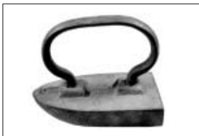
Fier aposta per stirar ils culiers da las chamischas dad um (Cuira).