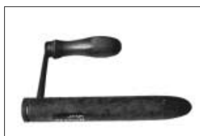
Fier aposta per far or murinellas (Cuira).