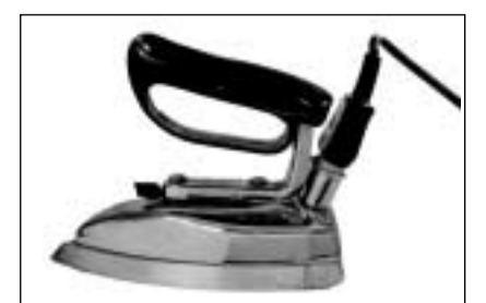
Fier electric cul moni da plastic e quatter graduaziuns da la chalur (Cuira, ca. 1950).