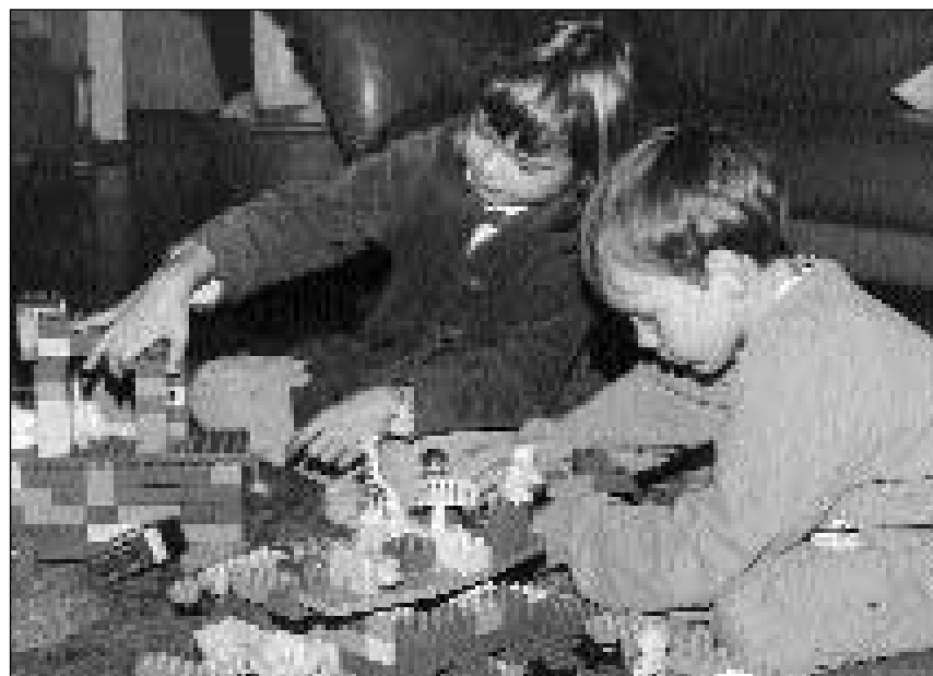
Duplo, la sora giuvna ma pli gronda dal tschep da lego.