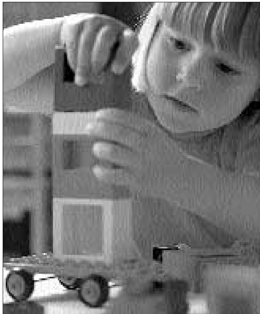
Il lego chatta gronda calamita tier ils uffants.