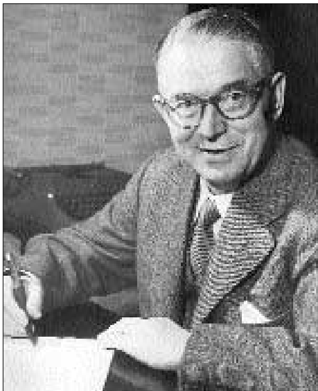
Il fundatur da l'interpresa Lego, Ole Kirk Christiansen (1891 – 1958)

Oz vegn la tscheppa da lego vendida en 130 pajais en pli che 60 000 stizuns. Ils lieus da fabricaziun èn Danemarc, la Svizra, ils Stadis Unids, Brasilia e Corea. Il 1997 ha la societad da la gruppa lego occupà 9400 collavurators, bunamain la mesadad da quels en Danemarc. En ina brochura da lego da quest onn pon ins leger: Uschia èsi «nossa finamira, ch'il logo Lego daventia la pli ferma marca dal mund tar famiglias ed uffants l'onn 2005.» Ma tut quai n'interessescha la mattatscha ed il mattatsch probablmain pauc u nagut cura ch'els avran il pac sut il pignol da Nadal. Els vegnan dentant segiramain a s'interessar per il carnet da reclama endadens la stgatlans da legos. Lez cuntogna fotografias da models da lego anc bier pli bels che quel ch'els han gist chattà en lur pac.